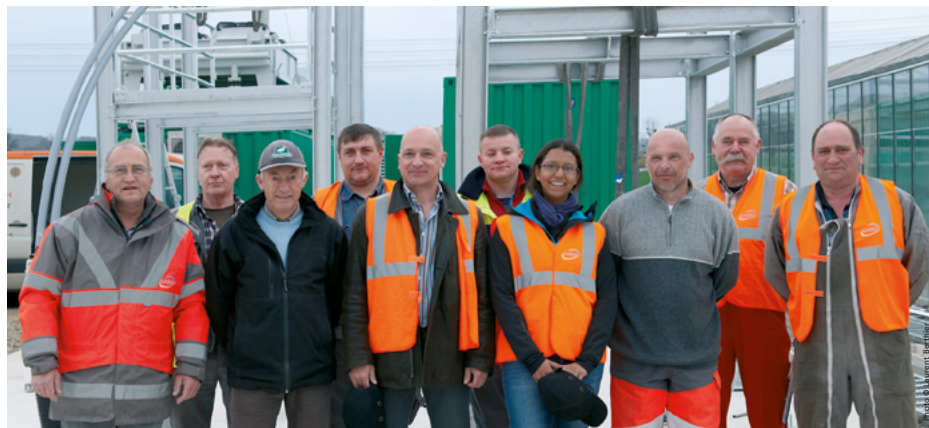
(une partie de l'équipe, un de nos clients et des partenaires de construction)

Pour assurer la meilleure valorisation énergétique de votre biogaz, jour après jour.